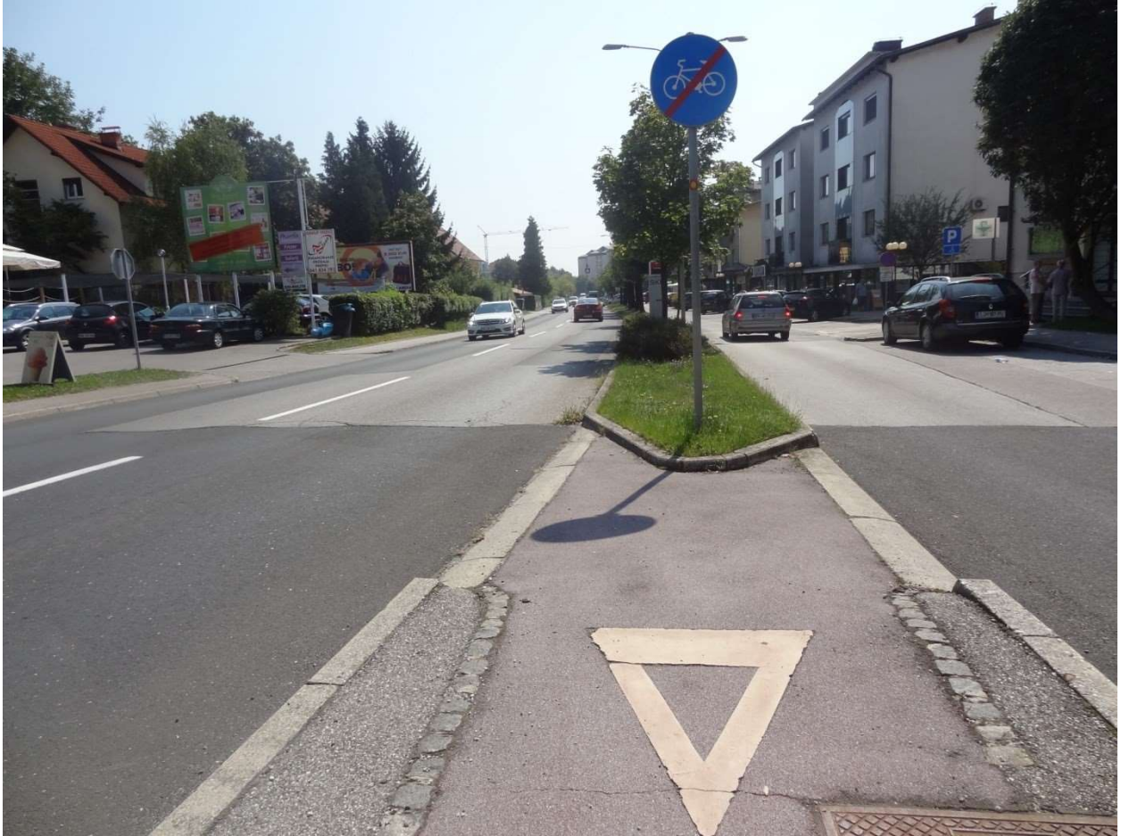
Nevarno vključevanje kolesarjev na cesto