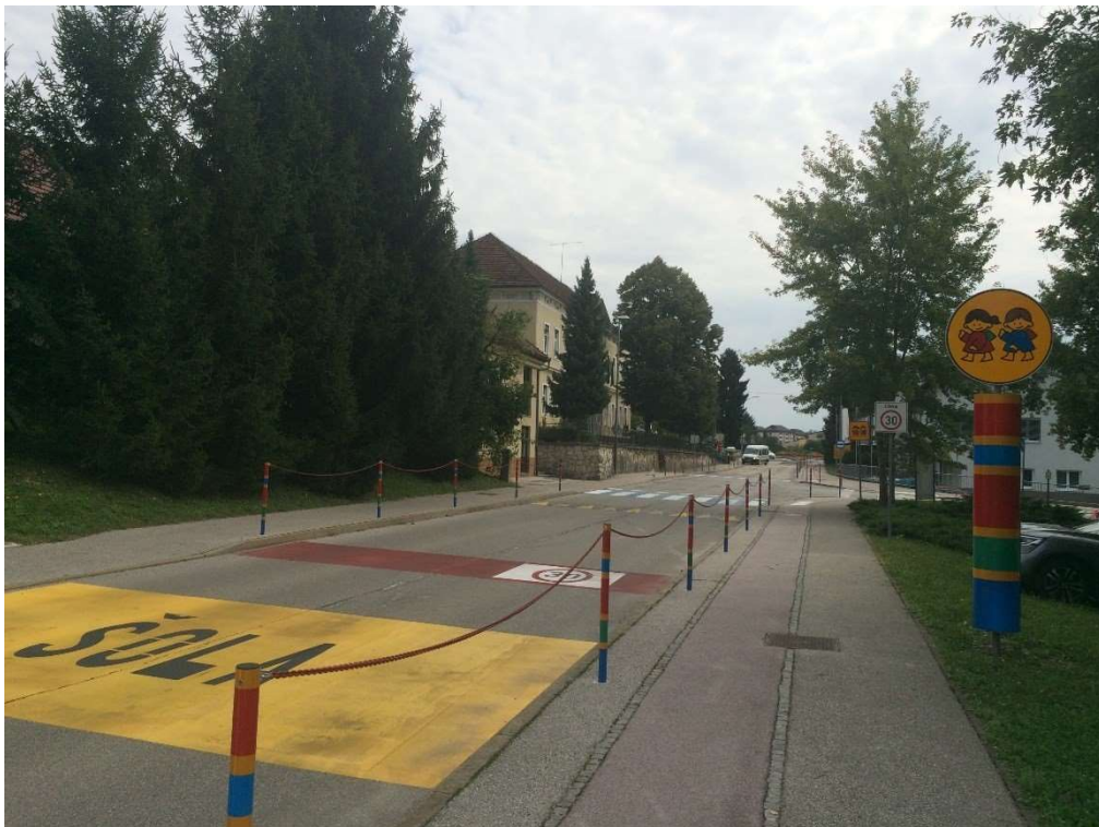
Cesta s talno označbo »ŠOLA«, opozorilno tablo in zaščitno verigo na pločniku