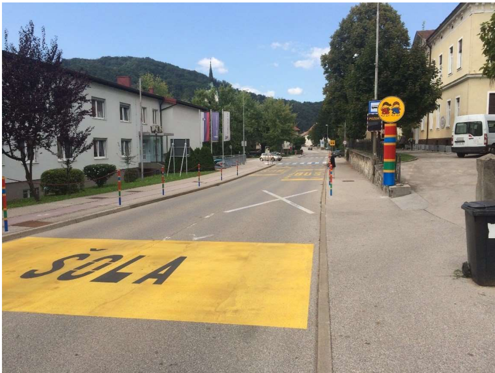
Dovoz na šolsko dvorišče in avtobusno postajališče na cestišču