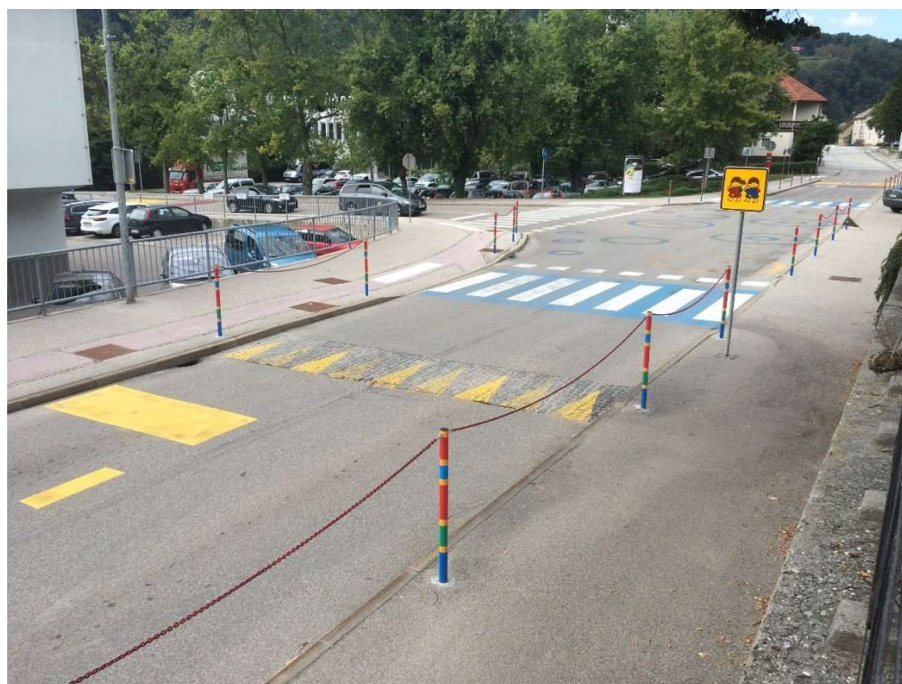
Prehod za pešce